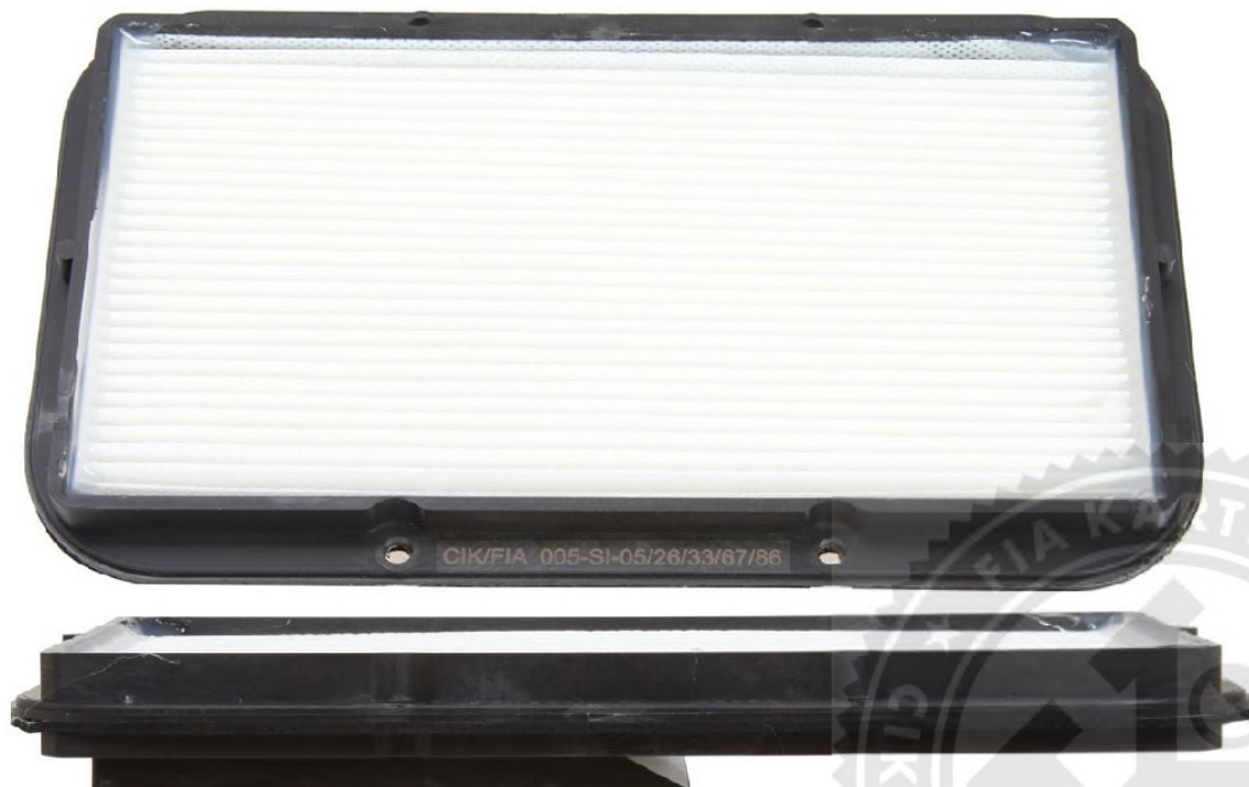
Photo du filtrant complet vu du haut et cote / Photo of the filter from above and from the side.