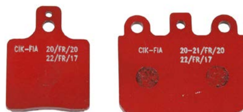
Plaquettes / Pads