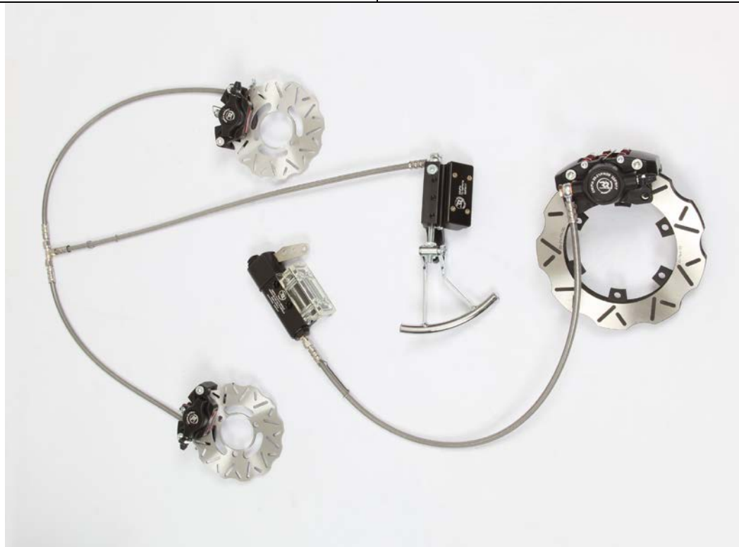
PHOTO VUE DE DESSUS DU SYSTÈME COMPLET ASSEMBLÉ PHOTO FROM ABOVE OF COMPLETE ASSEMBLED SYSTEM

This Homologation Form reproduces descriptions, illustrations and dimensions of the brake system at the moment of the CIK-FIA homologation. The Manufacturer may modify them, but only within the limits set by the CIK-FIA Regulations in force.