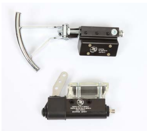
Maître-cylindre / Master-cylinder