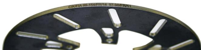
Disques / Discs