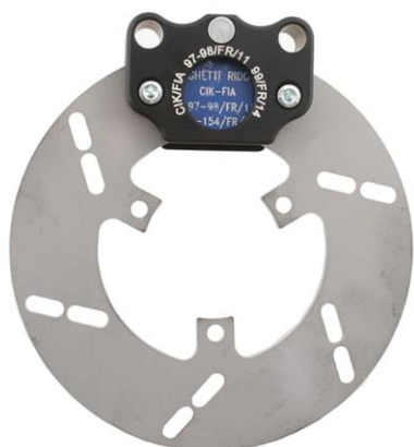
Photo du frein avant : étriers et disques seulement Photo of front brake: calipers and discs only