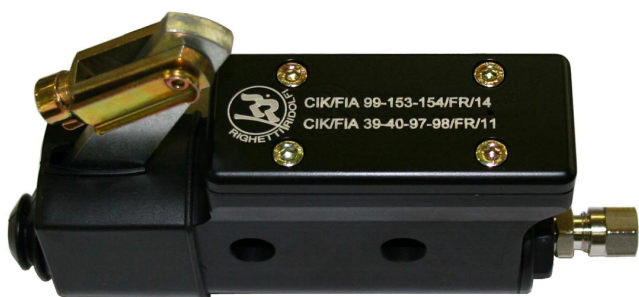
Maître-cylindre / Master-cylinder