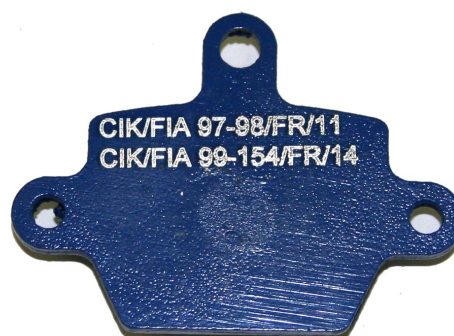
Plaquettes / Pads