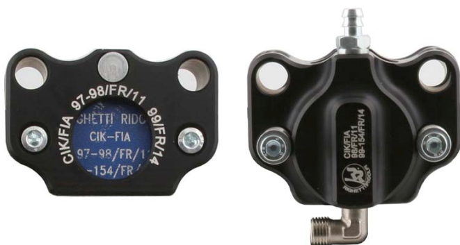
Etriers / Calipers